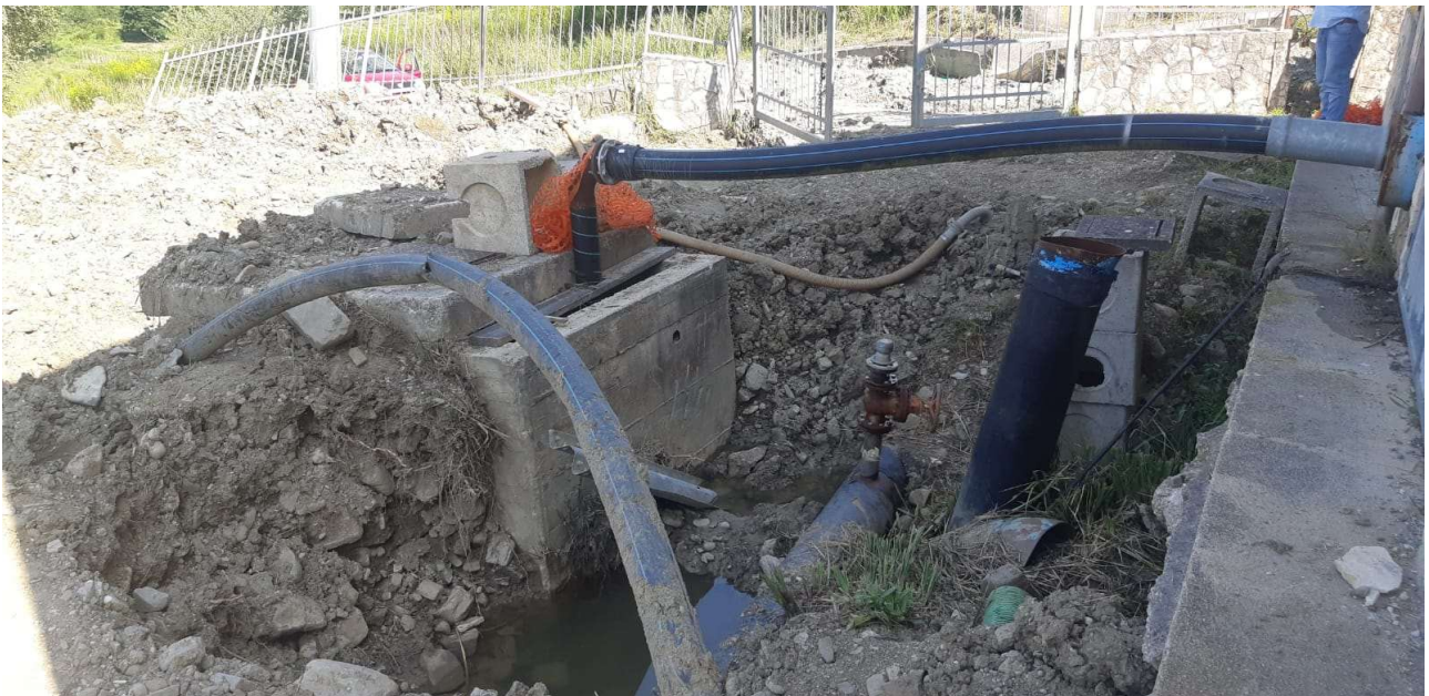
Figura 7 – Vista di dettaglio del piazzale e dei pozzetti 3