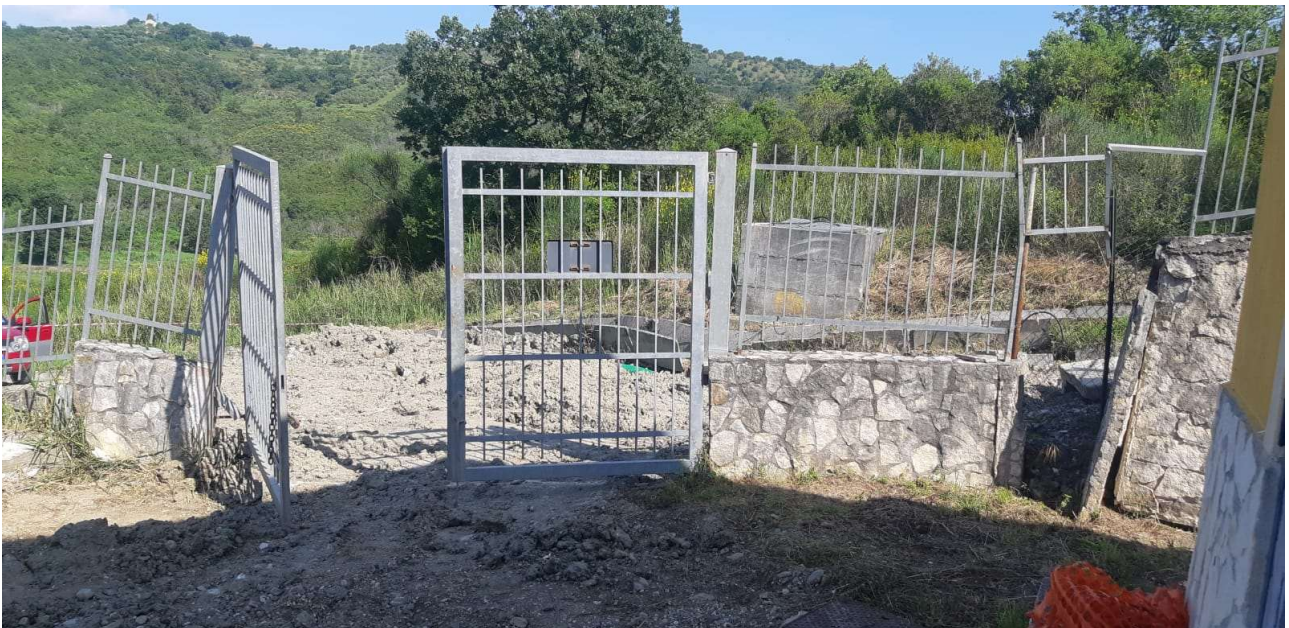
Figura 13 – Cancello di ingresso