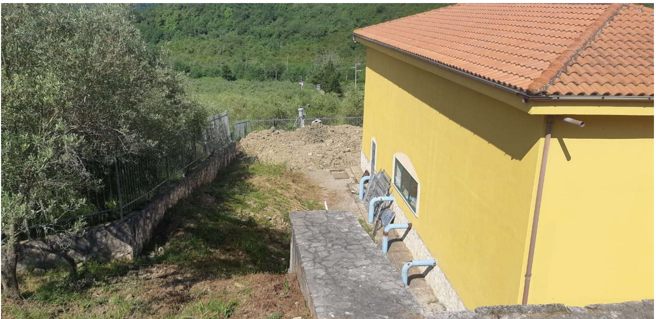
Figura 3 – Vista piazzale verso ovest