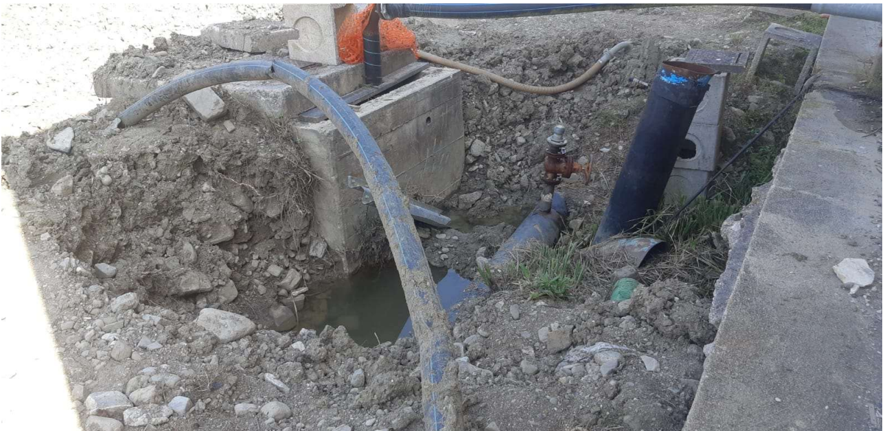
Figura 11 – Pozzetti e tubazioni