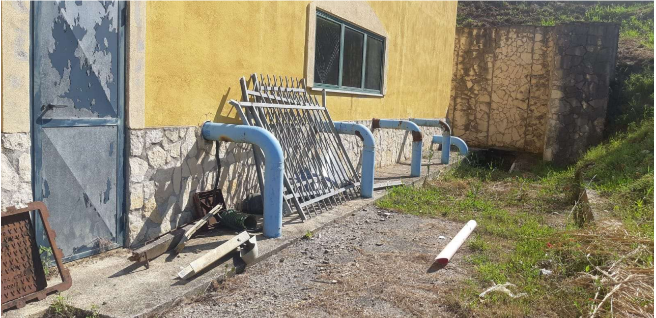
Figura 4 – Tubazioni