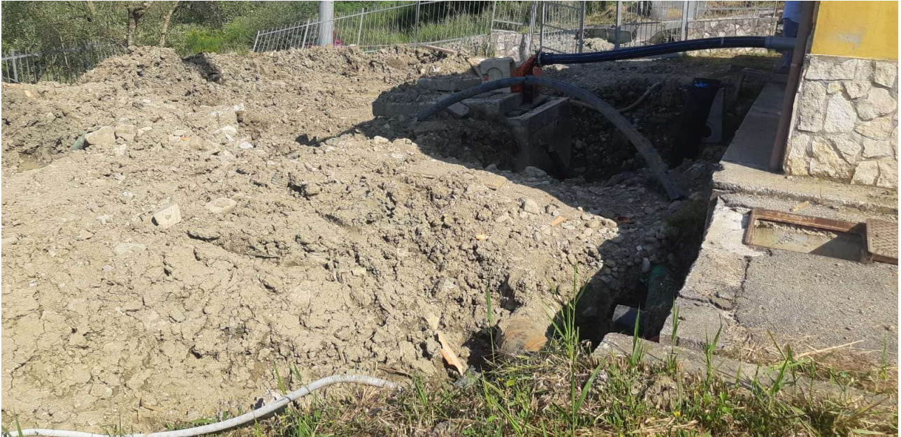
Figura 8 – Vista di dettaglio del piazzale e dei pozzetti 4