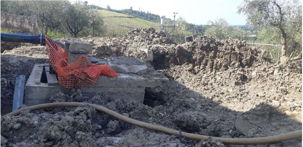
Figura 6 – Vista di dettaglio del piazzale e dei pozzetti 2