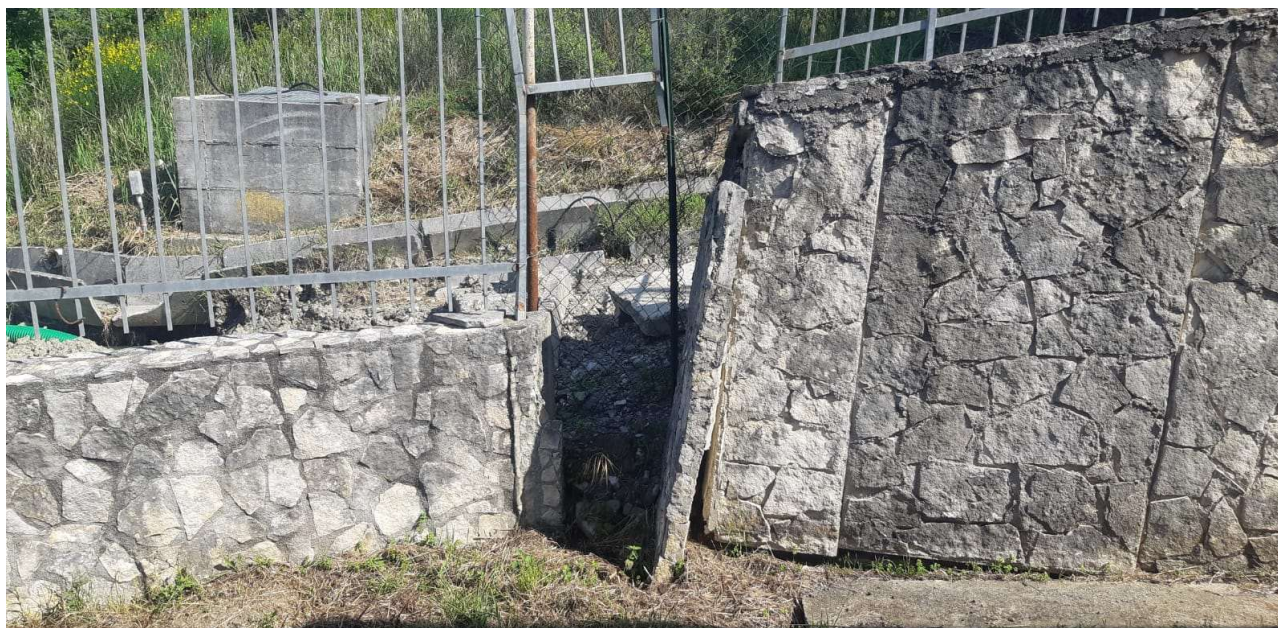
Figura 14 – Muretto di cinta