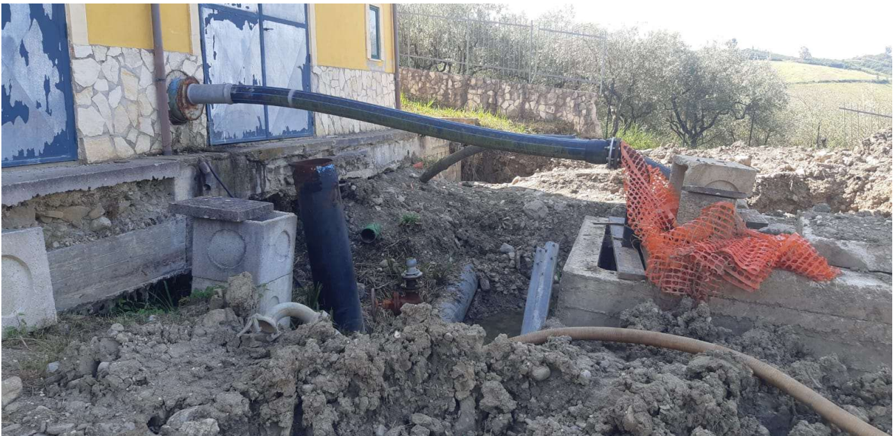
Figura 5 - Vista di dettaglio del piazzale e dei pozzetti 1