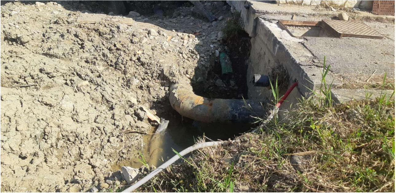
Figura 10 – Vista di dettaglio tubazione