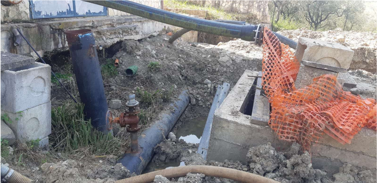
Figura 12 – Pozzetti e tubazioni