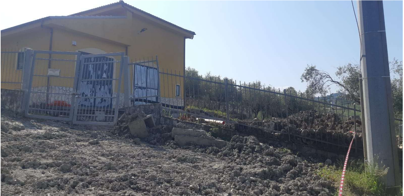
Figura 2 - Vista piazzale e impianto di sollevamento verso sud