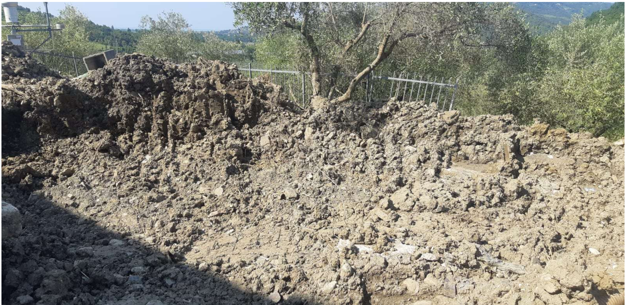
Figura 9 – Vista del piazzale verso nord-ovest