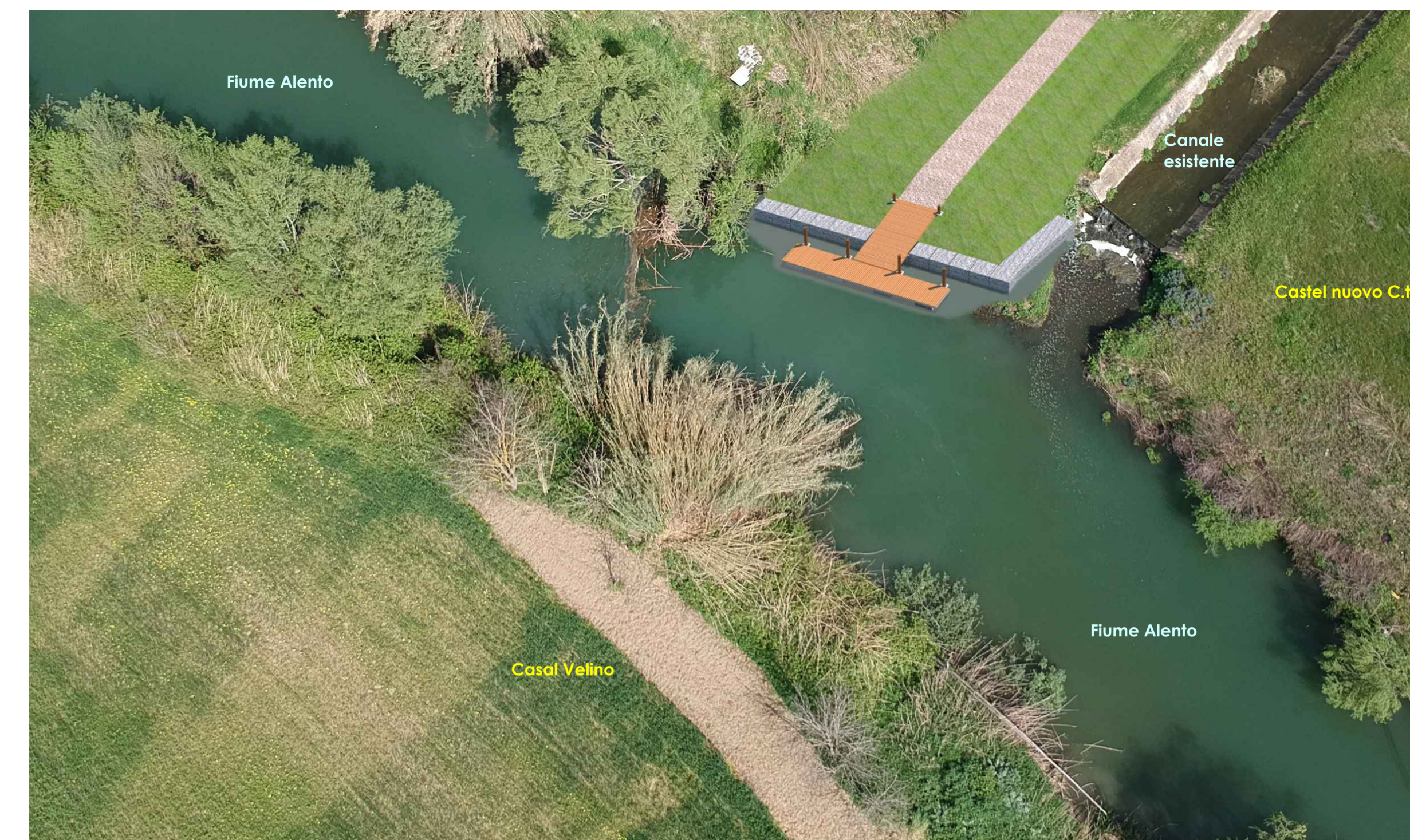
Fotoinserimento (vista da sud - est)