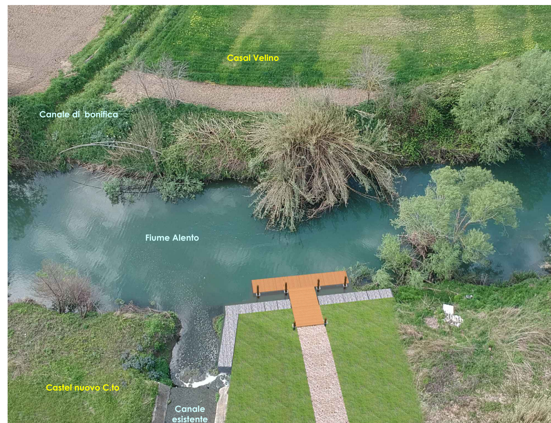
Fotoinserimento (vista da nord)