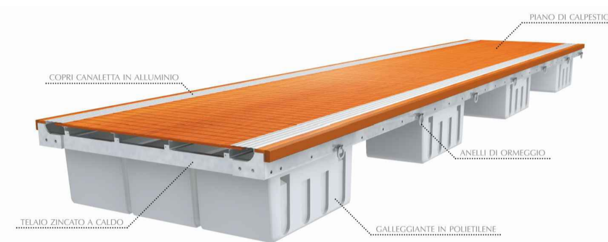
Tipologico molo galleggiante e removibile