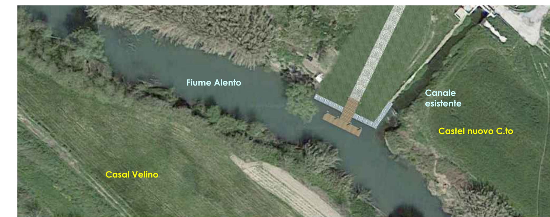
Fotoinserimento (vista da dall'alto su ortofoto)