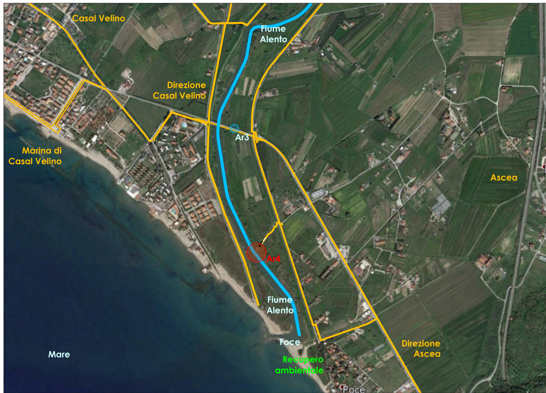
Inquadramento territoriale dell'attraversamento Ar4