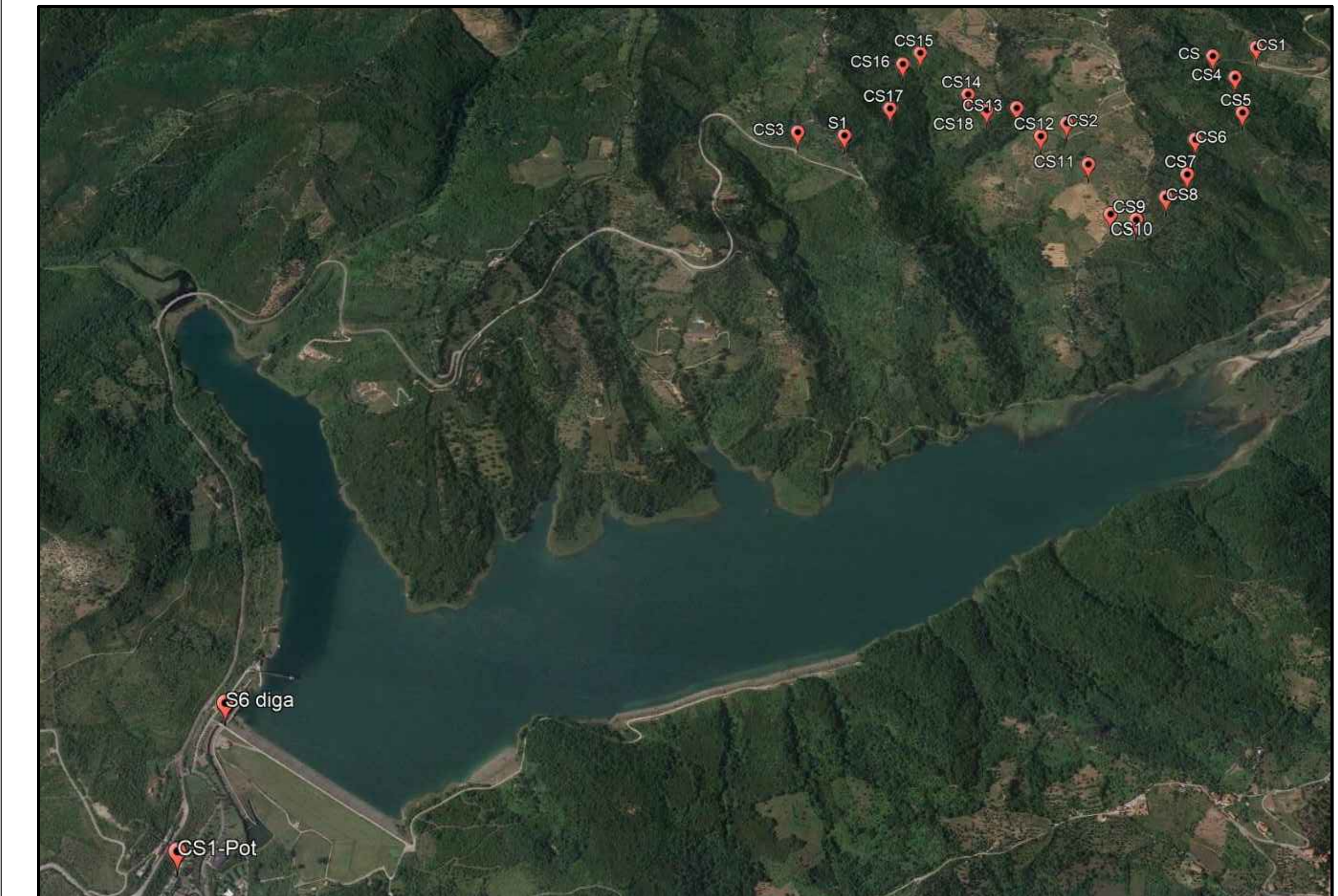
Planimetria con ubicazione caposaldi