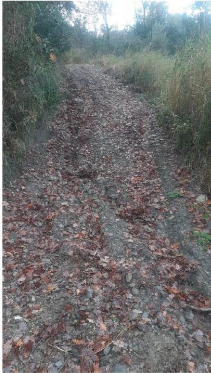
Stato di fatto