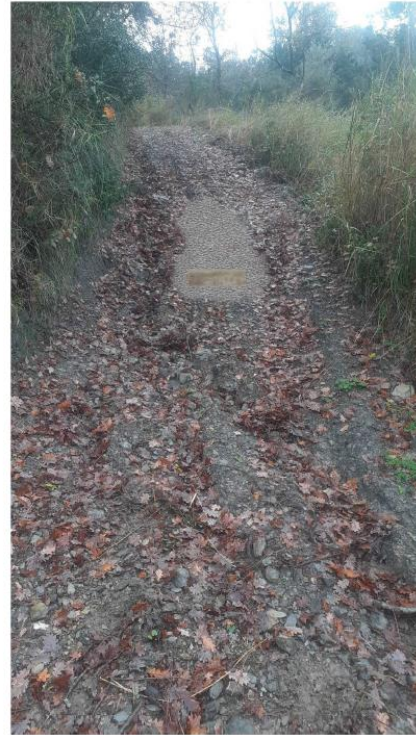
Fotosimulazione di progetto