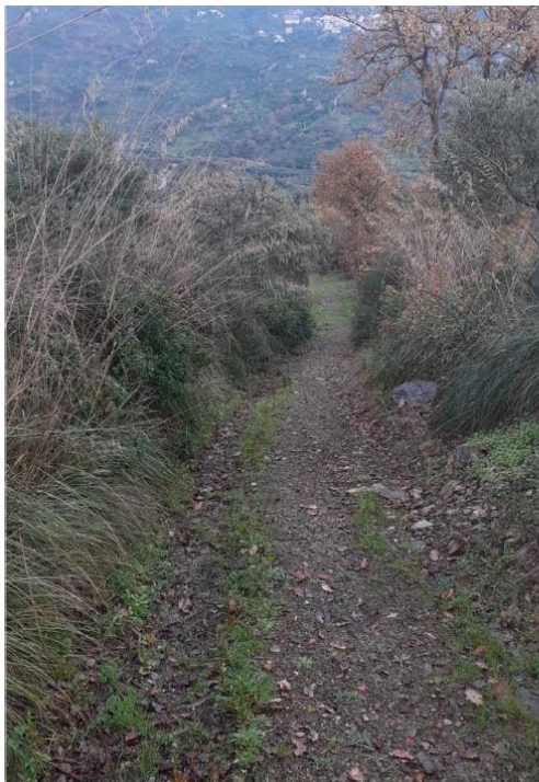
Stato di fatto

Piano straordinario di difesa idraulica e idrogelologica nei bacini del fiume Alento e della Fiumarella di Ascea (3° stralcio). Interventi di manutenzione straordinaria del reticolo idraulico di bonifica