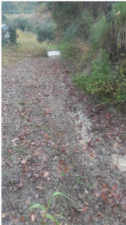
Stato di fatto