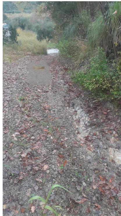
Fotosimulazione di progetto